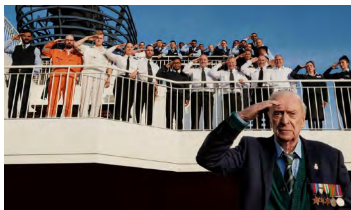
Michael Caine als veteraan Bernard Jordan in de film The Great Escaper .

Op woensdag 6 maart had de afdeling Limburg voor de leden een filmzaal in Foroxity Roermond afgehuurd voor de filmvoorstelling 'The Great Escaper'. De film vertelt het verhaal van de hoogbejaarde WO II-veteraan Bernard Jordan (Michael Caine) die uit zijn verzorgingstehuis ontsnapt om de 70-jarige herdenking van D-Day in Normandië bij te wonen. De leden werden ontvangen met koffie en een chocolaatje en in de pauze kon nog een drankje en wat lekkers uitgezocht worden. Het was een mooie film die we niet makkelijk zullen vergeten.