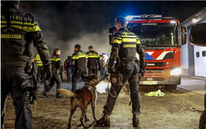
Het geweld tegen geüniformeerden neemt toe.

Op 20 maart vond in het Huis voor Veiligheid in Baarn het symposium 'Geweld tegen het uniform' plaats. Deze bijeenkomst werd georganiseerd door de Coalitie voor Veiligheid (CVV). Vertegenwoordigers en leidinggevenden vanuit onder andere politie, Defensie, brandweer, ambulancediensten en buitengewoon opsporingsambtenaren (boa's) namen hieraan deel.