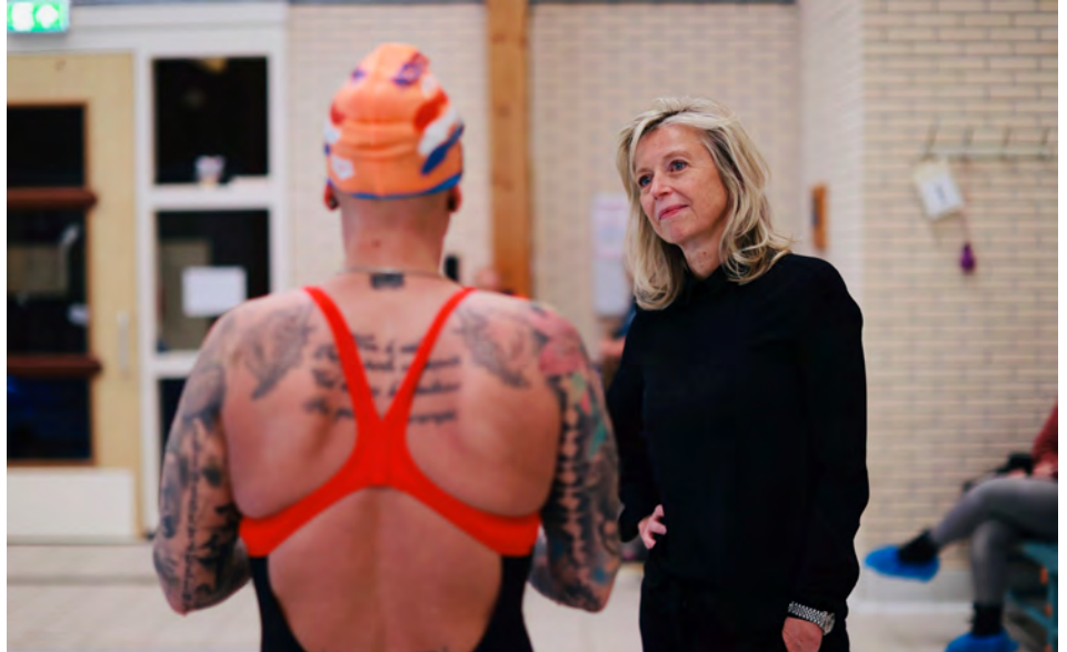
Minister van Defensie Kasja Ollongren, hier met een Invictus-sporter: "Ik betreur dat sommige dienstslichtoffers problemen ondervinden bij de toegang tot zorg."