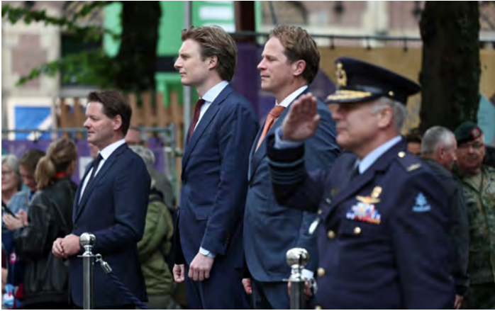
De nieuwe bewindslieden, minister Ruben Brekelmans (l) en staatsecretaris Gijs Tuinman, geflankeerd door de secretaris-generaal van Defensie en de Commandant der Strijdkrachten.

Ruben Brekelmans en Gijs Tuinman zijn de nieuwe bewindslieden op het ministerie van Defensie. De 37-jarige Brekelmans volgt minister Kajsa Ollongren (D66) op. De 44-jarige Tuinman neemt de taak over van staatsecretaris Christophe van der Maat (VVD).