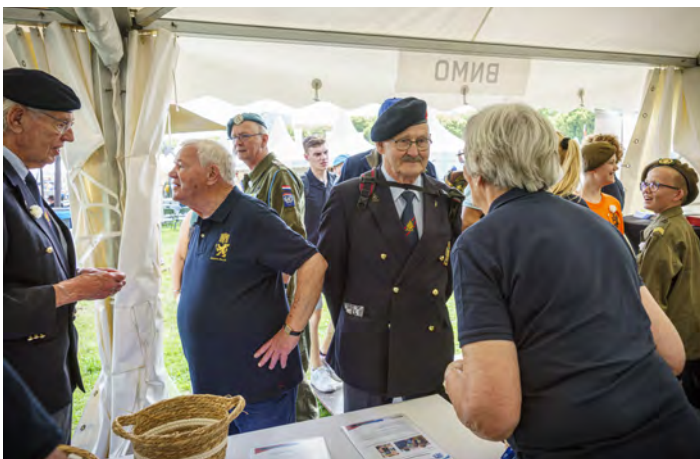
Grote drukte bij de BNMO-stand waarbij men zich ook liet fotograferen door onze fotograaf.

Na de opningsceremonie volgde de traditionele medaille-uitreiking waarbij postactieve veteranen de herinneringsmedaille aan een missie uitreiken aan actief dienende militairen die net hun eerste missie hebben voltooid. Daarbij