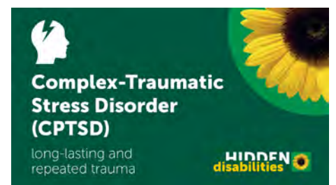
De Hidden Disabilities Sunflower.

Wij ontvangen veel positieve reacties en ervaringen hierop van onze leden alsook MOD-ers, dit naast de dienstslechterpas. De BNMO is in gesprek om meer uitingen en werkvormen voor dit mooie initiatief te gaan ontwikkelen in samenwerking met 'de eigenaren' hiervan. Het zal zeker een goede bijdrage geven voor hen die hiermee te maken hebben. Uiteraard houden wij u op de hoogte.