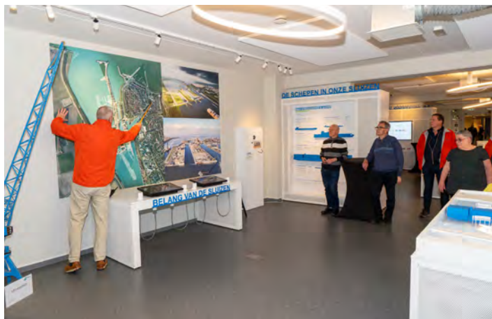
De gids geeft uitleg over de werking van de sluisen.

het sluisencomplex. Hier konden we de bouw van de nieuwe sluis met eigen ogen aanschouwen. Inbegrepen was een bezoek aan één van de kelders waarin de aandrijfmotoren en het contragewicht te zien waren. Heel indrukwekkend. Ondanks het slechte weer – bijna de hele dag – kunnen we terugkijken op een geslaagde dag.