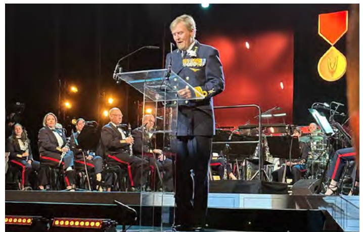
Koning Willem Alexander: ‘Veteranendag is inmiddels ingeburgerd.’