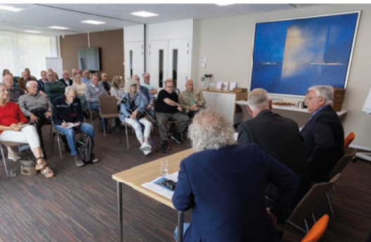
Ruim 50 leden waren aanwezig op de bijeenkomst in Doorn.

Of ook smartengeld kan worden vergoed hangt af van de vraag of u naast uw MIP ook de BIV ontvangt. Als u al een BIV ontvangt wordt er normaal gesproken geen smartengeld meer uitgekeerd. Als uw MIP te laag is voor toekenning van een BIV kan er wel recht bestaan op toekenning van smartengeld. ■