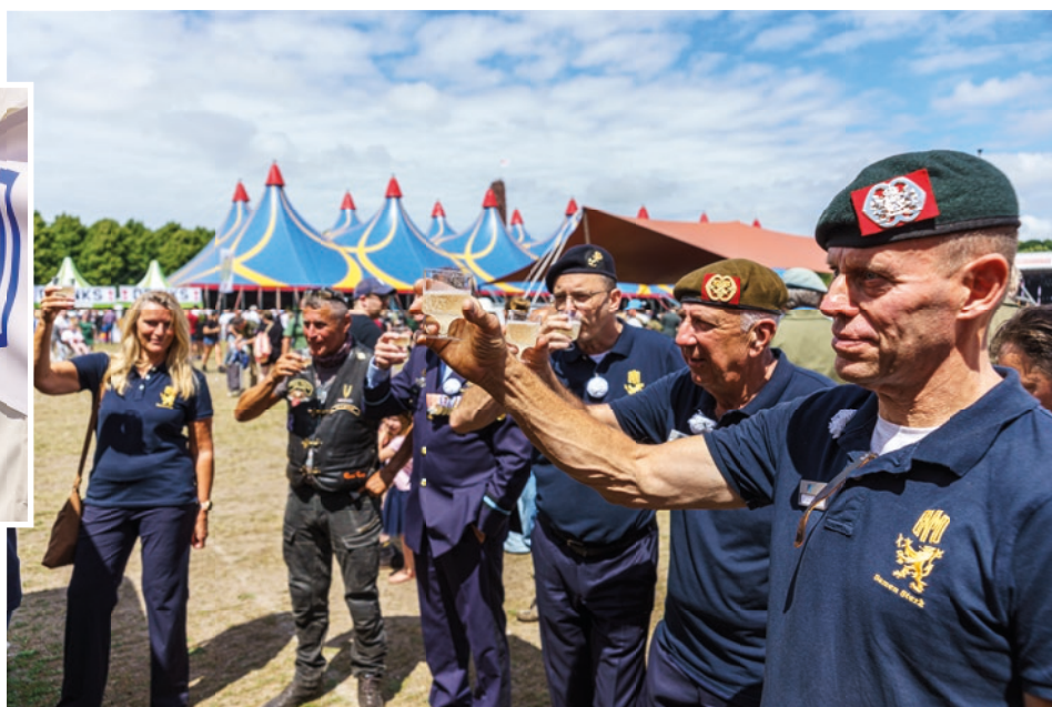
Het echte feest is natuurlijk op 30 augustus in Doorn waarop groots uitgepakt zal worden. Maar op het Malieveld werd het (champagne-)glas geheven om alvast te proosten op het 80-jarig jubileum van de BNMO.