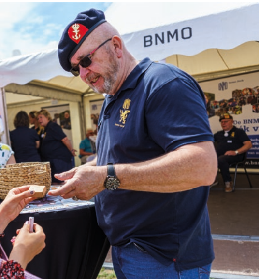
De BNMO mocht zich in een extra grote tent presenteren op het Malieveld. De drukke aanloop werd gestimuleerd door enkele vaandeldragers die de hele dag actief pepermuntjes uitdeelden aan de bezoekers.