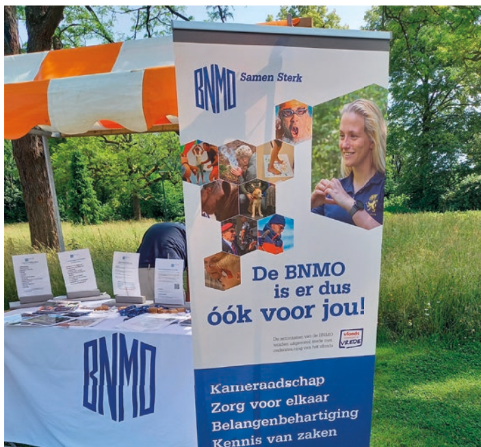
Het verslag met meer foto's staat op de website.

Zaterdag 14 juni was in Roermond de Limburgse Veteranendag. Deze was gezellig en goed verzorgd. Helaas kon de temperatuur niet geregeld worden, maar voor water werd goed gezorgd. De afdeling was met een stand aanwezig. (Berthy Deneer)