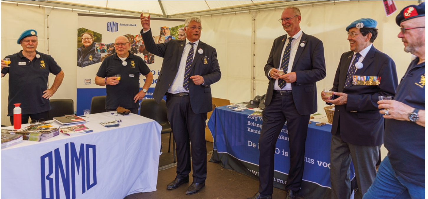
Op Veteranendag werd er alvast geproost op '80 jaar BNMO' in aanloop naar de jubileumviering op 30 augustus.

de BNMO kijken wij terug op een mooie, fijne en succesvolle Veteranendag 2025. Wij bedanken de organisatie NLVD en iedereen die deze mooie dag mogelijk heeft gemaakt!