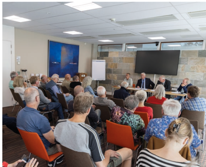
Hoge opkomst bij de door de BNMO georganiseerde bijeenkomst in Doorn over schadevergoedingsregelingen.