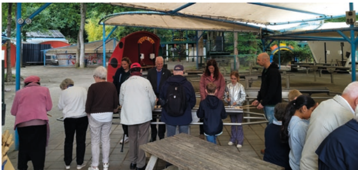
Samen je eigen stokbrood bakken in Dieren. Gezellig en leerzaam!