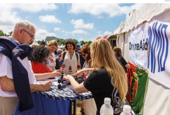
Bij de BNMO-tent was er ook ruimte gecreëerd voor de stichting DroneAid Collective die bestaat uit Oekraïners in Nederland die workshops organiseren voor gewonde Oekraïense veteranen die in het MRC gerevalideerd zijn (zie ook pagina 8 en 9). Later dit jaar gaat de BNMO met hen een gezamenlijke workshop organiseren.