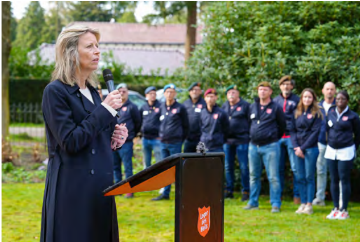
Demissionair minister van Defensie Kasja Ollongren bij de opening van herstellocatie Sparrenheuvel.

Demissionair minister Kasja Ollongren opende op 9 april een kleinschalige herstelplek voor veteranen met een post-traumatische stressstoornis (PTSS) in Bosch en Duin. De opvanglocatie met de naam Sparrenheuvel is opgericht door het Leger des Heils in samenwerking met het Nederlands Veteraneninstituut. In Sparrenheuvel is plek voor 10 tot 12 (oud-)militairen die hulp nodig hebben bij een psychisch trauma. Hun behandeling wordt in gang gezet of voortgezet en na 3 tot 6 maanden kunnen ze weer naar huis of stromen ze door naar een andere instelling.