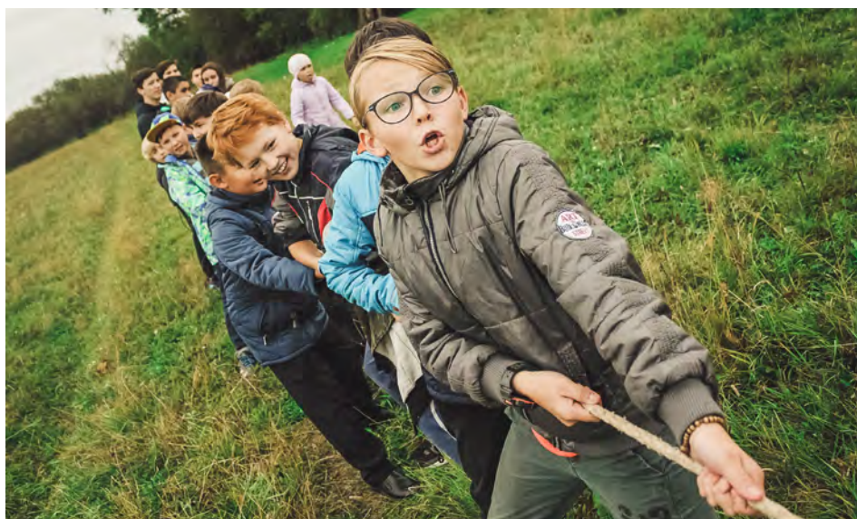
Outdoor weekend.

Het belooft weer een topweekend te worden. We trekken door het bos, we doen aan buitenspelen en hebben veel plezier met elkaar. Zaterdag staat in het teken van outdoor activiteiten. Wat dit gaat zijn is nog een verrassing. Op zondag zullen jullie helemaal uitgewaaid en met een fris gevoel weer naar huis vertrekken. (FL) ■