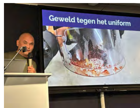
Het symposium 'Geweld tegen het uniform' vond op 20 maart plaats.

Onze algemeen voorzitter heeft op verzoek een presentatie gehouden op een landelijk symposium van de Coalitie voor Veiligheid (CVV) met de titel 'Geweld tegen het uniform'. Vijftien vakbonden en beroepsorganisaties uit de sector veiligheid (alle geüniformeerden) werken samen in de CVV teneinde een sterk front te vormen om de politiek te bewegen meer te investeren in veiligheid. De CVV staat voor de veiligheid van Nederland en heeft een goed beeld van wat daarvoor nodig is, zo bleek ook tijdens dit symposium.