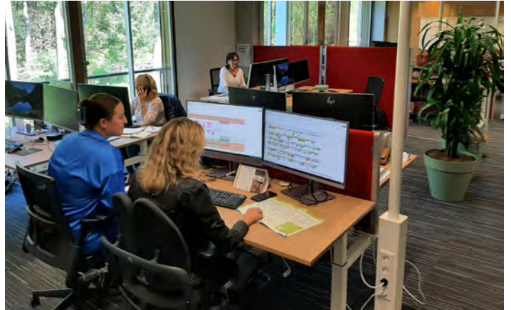
De Servicedesk van het Nederlands Veteraneninstituut.

Het programma-aanbod, je hebt er lang naar uitgekeken en dan valt het op de deurmat. Benieuwd welke programma's de BNMO dit jaar aanbiedt, ga je lezen en zie je enkele programma's staan die je aanspreken. Via het aanmeldingsformulier of de website meld je je aan, maar wat gebeurt er dan met je aanmelding? We geven je een kijkje achter de schermen bij de Servicedesk van het Nederlands Veteraneninstituut.