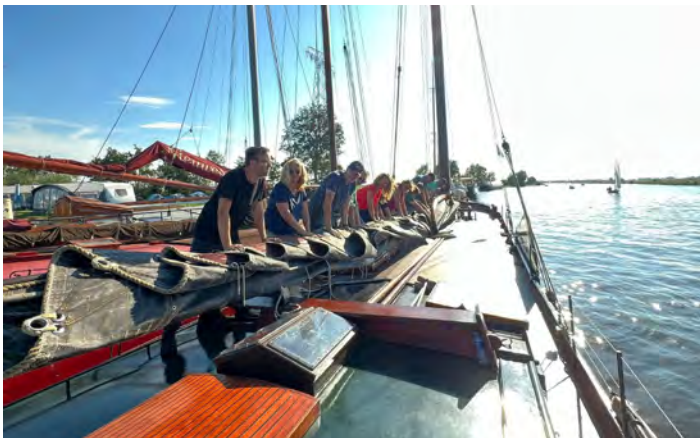
De afdeling Friesland organiseerde op 8 september weer het traditionele Skûtsjesilen. Zie pagina 17 voor een verslag.

In willekeurige volgorde worden we getraakteerd op muziek van een boel mooie organisaties: de Marinierskapel der Koninklijke Marine, Tamboers en Pijpers van het Korps Mariniers, Koninklijke Kapel 'Johan Willem Friso', Orkest Koninklijke Luchtmacht, Orkest Koninklijke Marechaussee, Fanfare 'Bereden Wapens', Regimentsfanfare 'Garde Grenadiers en Jagers', Vrouwelijke strijders 'Jo Quail en Maria Franz', The International Tattoo Pipes and Drums begeleid door The International Tattoo Highland Dance Team, The Guards Band of