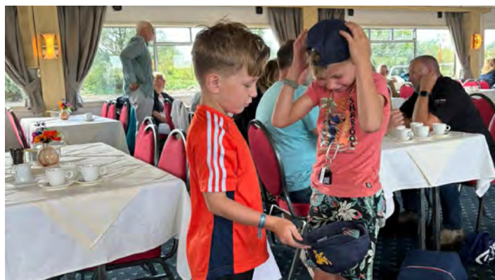
Ook kinderen amuseerden zich prima aan boord.

Op zondag 8 september vond weer de jaarlijkse cruise plaats die de stichting Nu of Nooit aanbiedt met medewerking van de BNMO. De vaartocht is bedoeld voor fysiek en mentaal gewonde 'geüniformeerden'. Zo'n 135 BNMO-leden met partners en kinderen genoten van een mooie bootreis vanaf Deventer naar Zutphen, waar een rondleiding met gids op het programma stond.