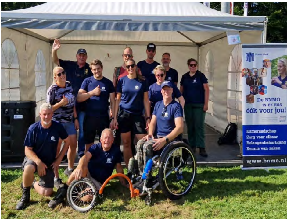
Naast het Programma Aanbod zijn er ook de afdelings- en landelijke activiteiten, zoals de deelname aan de Airborne Wandeltocht op 8 september j.l. Zie ook pagina 17.

Zaterdag 2 november vindt al weer de laatste Bondsraad van 2024 plaats. Deze vergadering vindt fysiek plaats in Doorn. ■